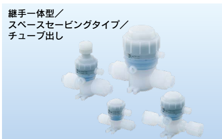
継手一体型／ スペースセービングタイプ／ チューブ出し